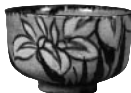
染付錆絵社若図茶碗 尾形乾山