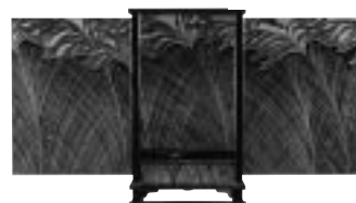
薄文の梅 平文大場松魚 昭和5年 当館蔵