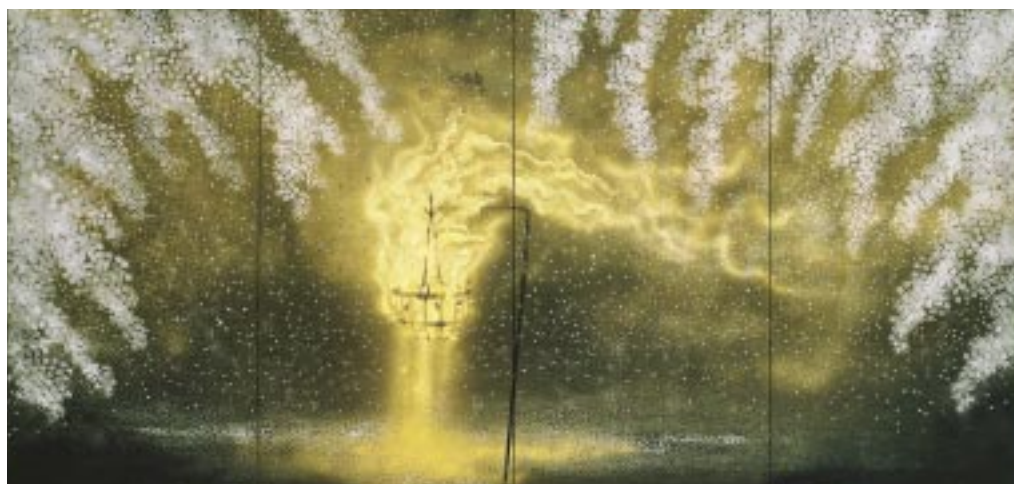
春宵 加山又造 昭和60年 第12回創画展 個人蔵