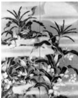
玉蜀黍群虫図 木村雨山