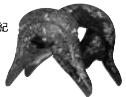
桜螺細鞍 鎌倉 13世紀 文化庁蔵