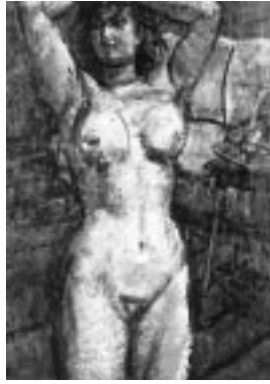
(右)裸婦 昭和27年 (左)アラブの旅 昭和50年