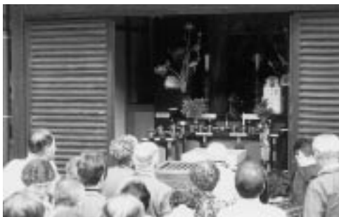
昨年度の文化財現地見学(上・勤修寺、下・安楽寿院)