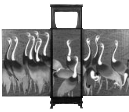
蓬萊之棚 松田権六