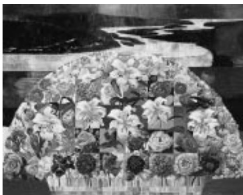
光の河と花の染譜 平成9年 芝田米三 個人蔵