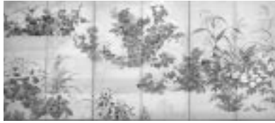
秋草図 喜多川相説 江戸 17世紀 当館蔵