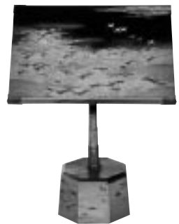
時絵和歌の浦図見台 伝清水九兵衛