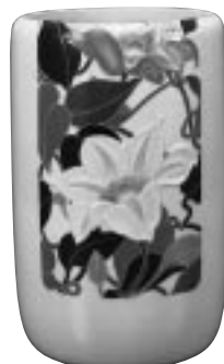
彩斑花瓶 夏日 東京国立近代美術館蔵