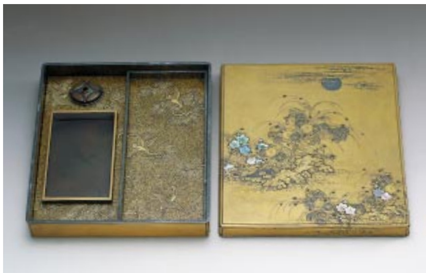
県文 蒔絵螺鈿秋月野景図硯箱 五十嵐道甫 江戸17世紀 当館蔵