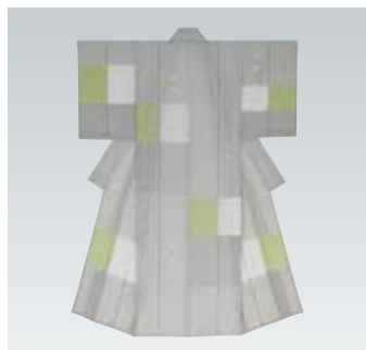
日本工芸会会長賞 《穀織着物「Garden」》 海老ヶ瀬順子(京都)