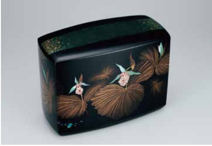
第70回記念賞 《時絵箱「木洩日の熊谷草」》 鬼平慶司(石川)