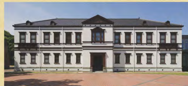
明治31年建築の旧陸軍第九師団司令部庁舎（現国立工芸館）

明治期以降、全国に陸軍施設が建築されましたが、本県には、赤レンガが特徴的な旧金澤陸軍兵器支廠兵器庫をはじめとし、旧陸軍第九師団司令部庁舎、旧陸軍金沢偕行社そして旧陸軍第九師団長官舎などの多くの旧陸軍施設がまともに残されています。これらと他県に残された旧陸軍施設を比較すると非常に似た外観や間取りを持つことに気付かされます。当時の兵器庫の建築例によれば、明治末期から大正期頃には建物の建築に際して、陸軍本省から「設計要領書」なるものが送られていることが判明しており、これは、ある程度の建築内容が盛り込まれた標準設計ともいえるべきものであったと思われます。そんな標準設計で作られたとしか思えない建築例をいくつか紹介いたします。