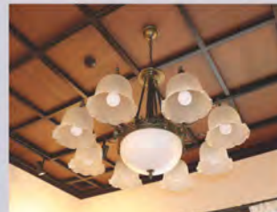
旧応接室（現ガイダンス室）の照明器具

文化財の価値の一つに、外壁や建具、間取りなどが建築当初の姿のまま保存されているということが挙げられます。一方で、照明器具などの設備となると、時代の変化の中で、建築当初の設備が更新されていることが多く、重要文化財であっても建築当初の設備が失われていることがあります。ところが、旧陸軍第九師団長官舎を調査した専門家からは、本建築には当初の照明器具が残っているとの報告がなされており、2016年のリニューアルの際には、照明のグローブなど欠損した部分を補い、再利用しています。この照明も大正の雰囲気をも伝える大切な文化財です。