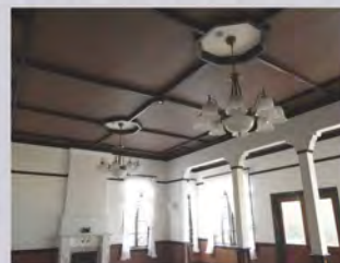
旧食堂（現多目的室）の天井

旧陸軍第九師団長官舎の各部屋の天井を見るとデザインが部屋ごとに異なることが分かります。旧応接室（現ガイダンス室）の天井は板張りの格天井となっており、旧食堂（元多目的室）の天井は板張りの天井で、照明器具廻りにのみ漆喰が施されています。このように、天井のデザインのアレンジによって、部屋の個別化を図っている点もこの建物の隠れた見どころとなっています。また、廊下の天井にも見事な左官の技が随所に施されています。