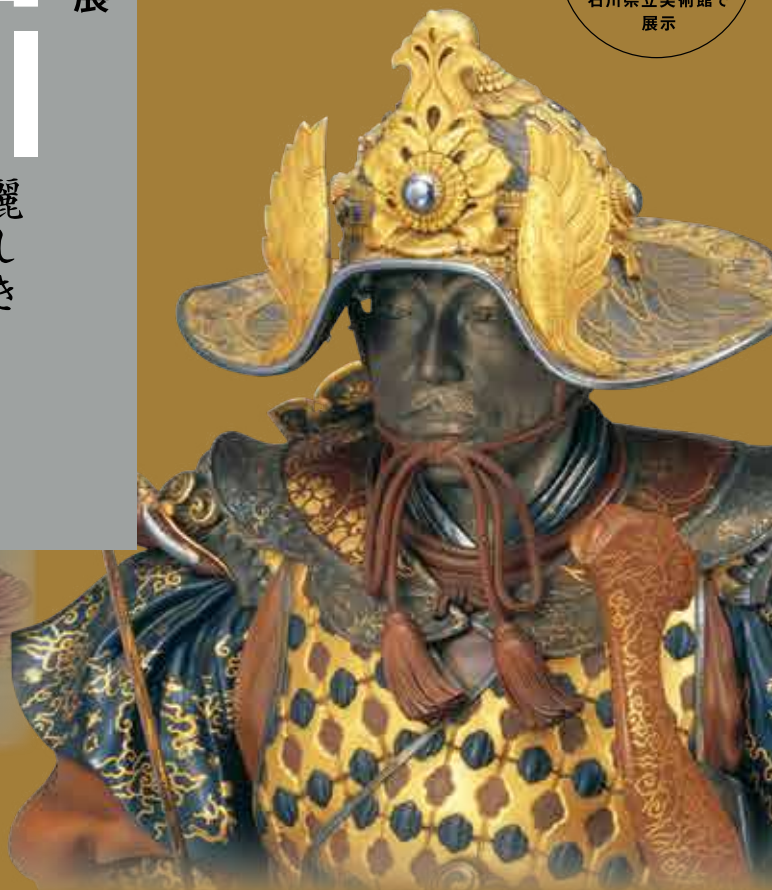
《太平楽置物》(部分) 海野勝珉 1899年 皇居三の丸尚蔵館収蔵 国立工芸館で通期展示

The Imperial Household and Ishikawa: Brilliance of Elegant Beauty Masterpieces from The Museum of the Imperial Collections, Sannomaru Shōzōkan