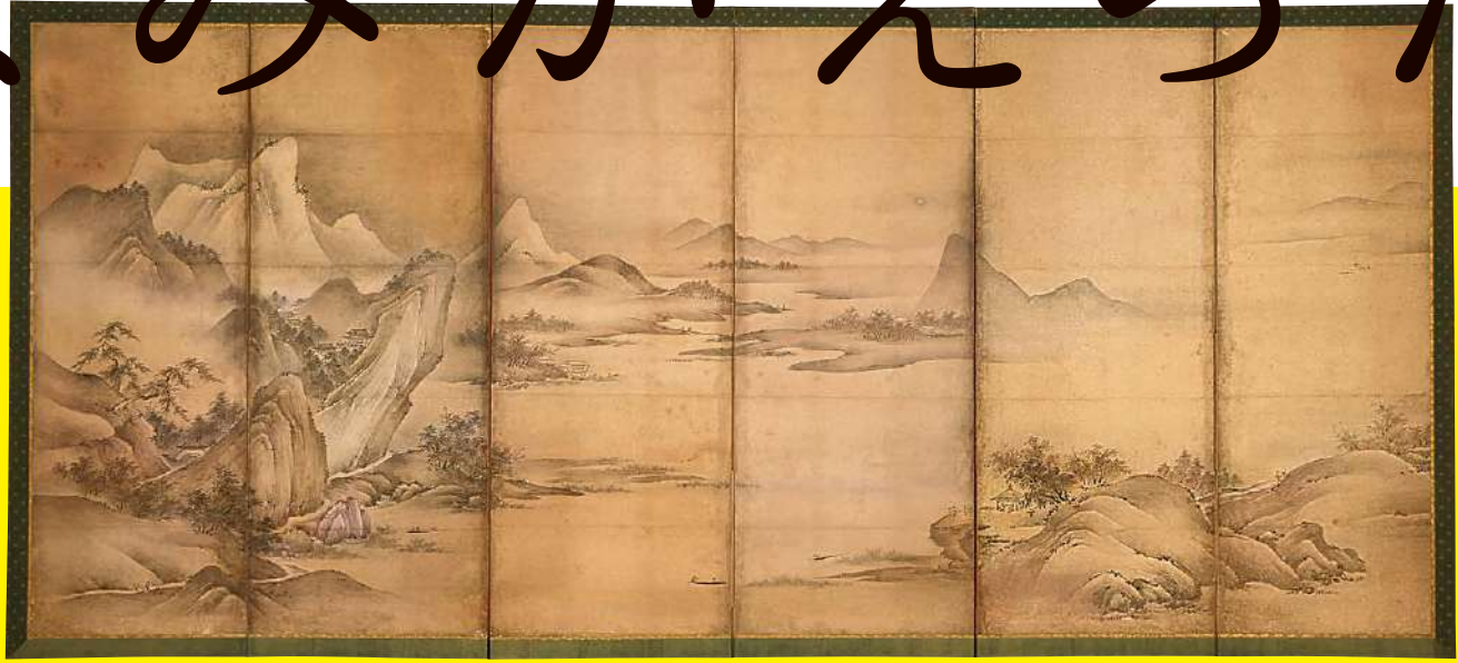
《山水図》伝狩野元信 石川県立美術館蔵 上／修復前 下／修復後