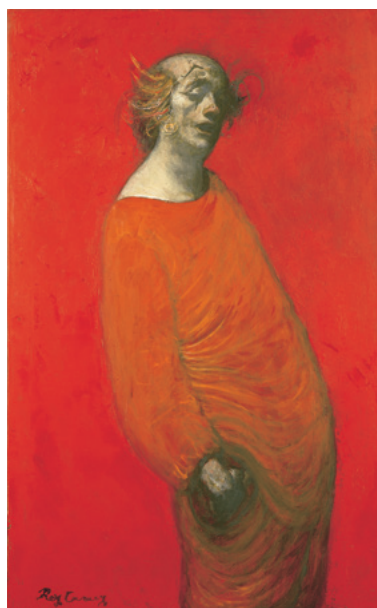
鴨居玲《出を待つ（道化師）》1984年 –「写真の中の鴨居玲–内なるCamoy 外なるCamoy–」より–