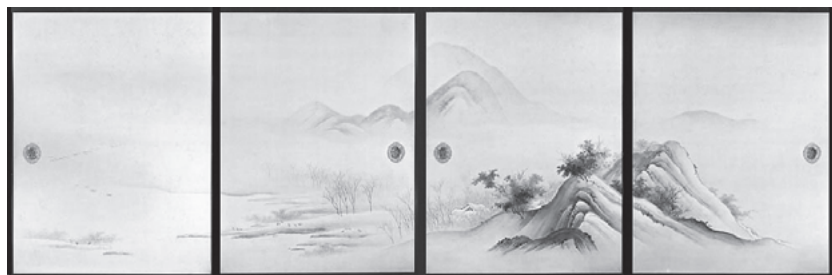
橋本雅邦《四季山水図》のうち秋景