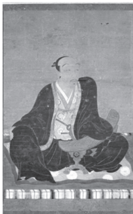
石川県指定文化財《前田利家画像》

利家の在世、前田家の所領は、加賀・能登・越中3カ国あわせて七十七万石に及びました。まさに百万石の礎を築いた存在である利家とその時代を、作品から振り返ります。