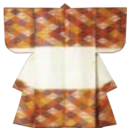
能装束 束 前田家伝来 色変鶴菱文唐織

さて当ショップにも新しいミュージアムグッズがお目見え。お待たせしました、「一筆箋」です。「えっ...? なかったの、今まで?」という声も聞こえてきそうですが、それはさておき、県美特製一筆箋は、「国宝色絵雉香炉」(写真下左)をはじめ、「はんかい草の図」(同中)、「色変鶴菱文唐織」(同右)の全部で三種類。写真上は本物の「色変鶴菱文唐織」です。小さすぎてわかりにくいんですけど、肩と裾部分は鶴文様(向鶴菱)、それが幾何学的に連続して並んでいます。白っぽく見える腰の部分は、丁字唐草の連続文様で、多色と単色を対照的に組み合わせ、前田家伝来の華麗な能装束なのです。この名品を一筆箋の一つに取り入れてみました。さあとは使う人の腕次第。達筆でピシッと決めれば、いうことなしですね。