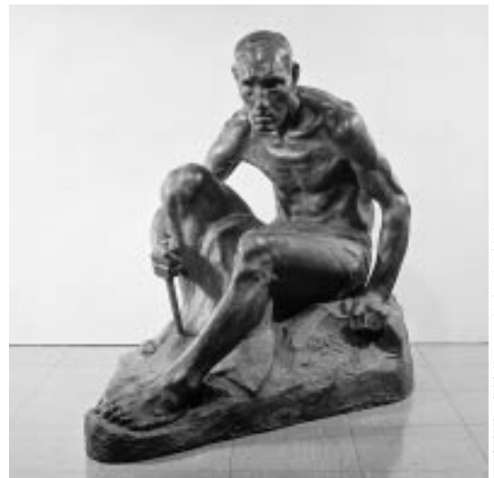
老坑夫 東京国立近代美術館蔵