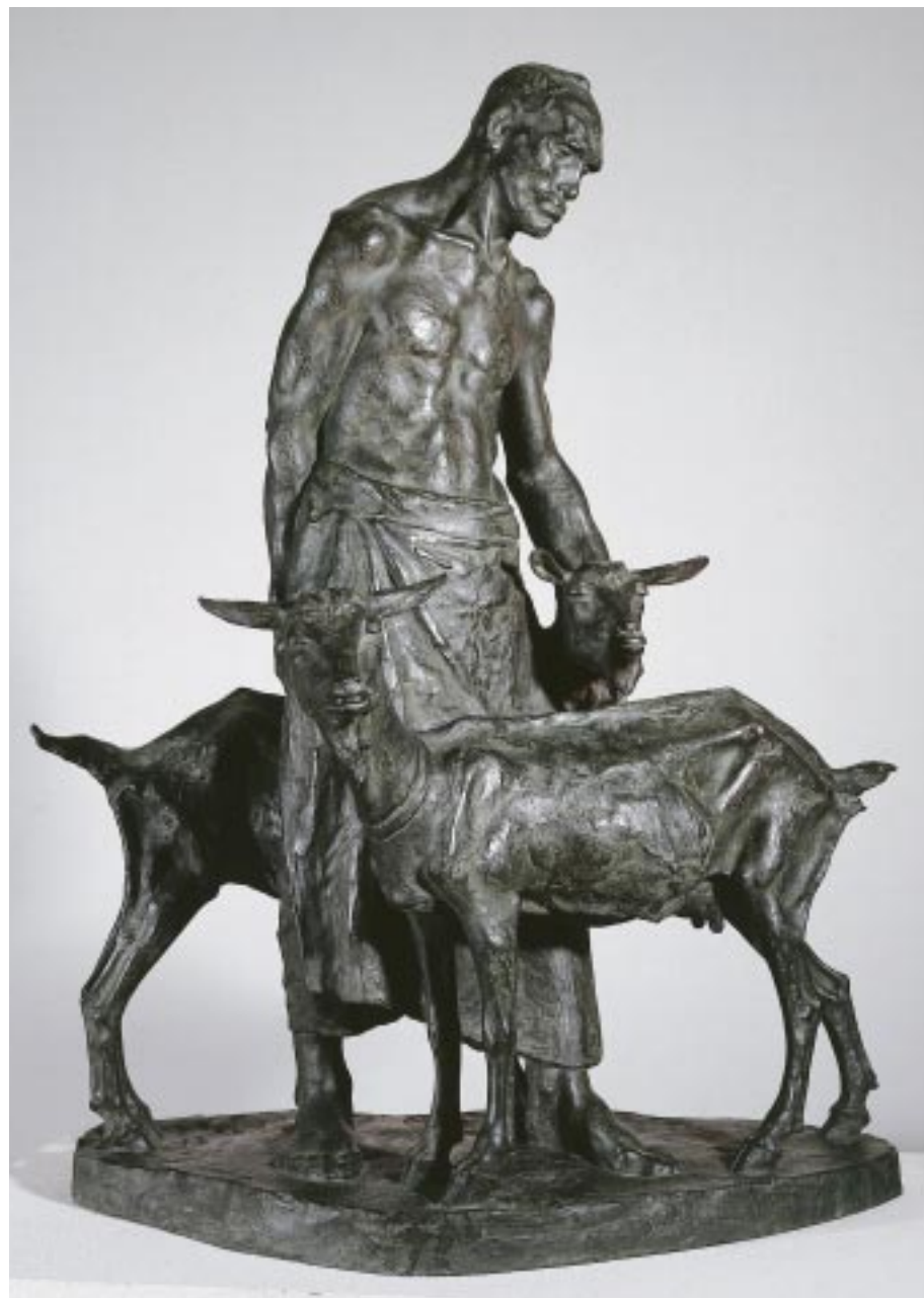
山羊を飼う老人 当館蔵