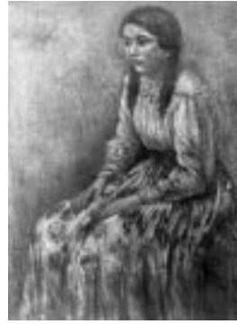
ロシアの少女 藤井外喜雄