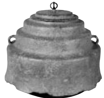
段々釜 初代宮崎寒雉