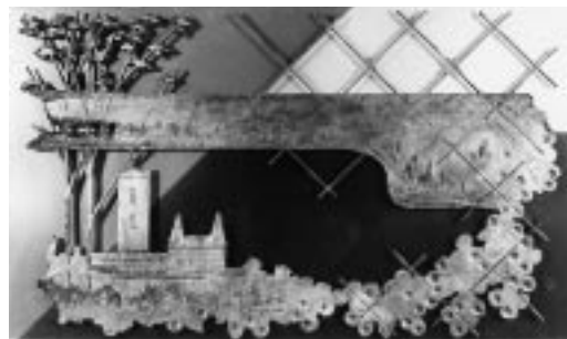
白銅浮彫「豊穰なるライン」 蓮田修吾郎