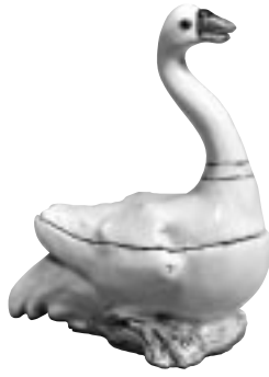
和蘭陀白雁香合 デルフト窯